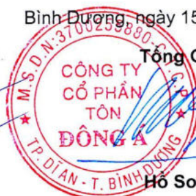
Hồ Song Ngọc